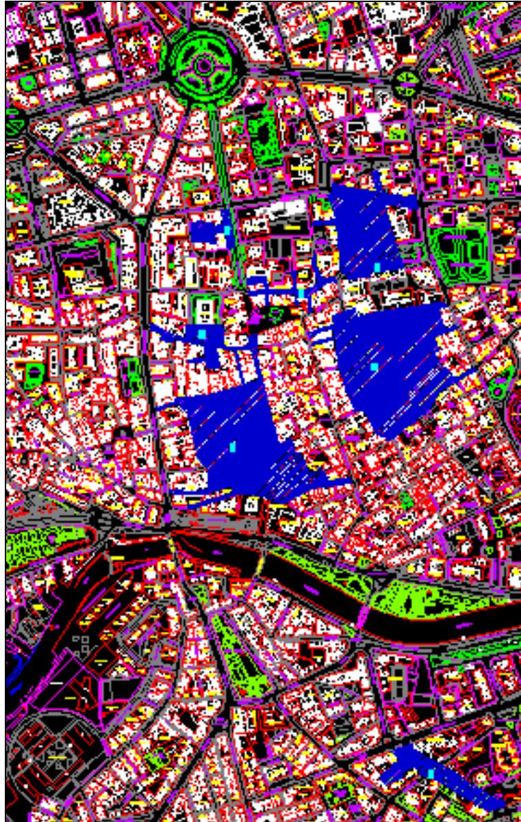
Ilustración 2: Localización de las Zonas de Especial Protección del Medio Ambiente del Núcleo Urbano de Murcia.